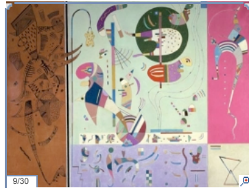
Kandinsky protagonizará el otoño alemán con la mayor exposición en 30 años